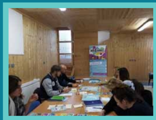
480 professionnels formés