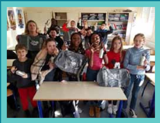
Refonte du site PSJ : participation de 100 jeunes et de 17 parents