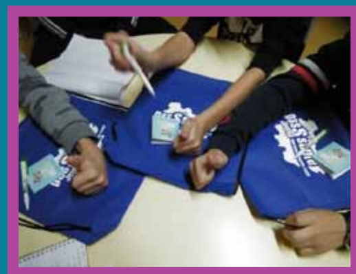
Plus de 200 actions développées en direction des jeunes, de parents et de professionnels