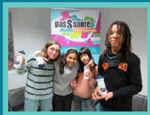
260 professionnels aux journées départementales/territoriales PSJ. Certaines ont été ouvertes aux jeunes soit 50 (départements 70, 71 et 89)